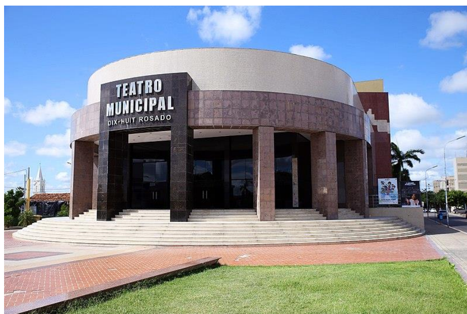
Imagem 03: Fotografia externa / Teatro Municipal Dix-Huit Rosado Fonte: http://www.teatrodixhuitrosado.com.br/ Acessado em 15/08/2019