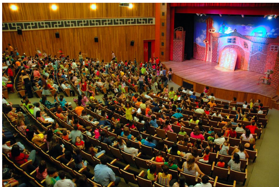
Imagem 02: Fotografia interna / Teatro Municipal Dix-Huit Rosado Fonte: http://www.teatrodixhuitrosado.com.br/ Acessado em 15/08/2019