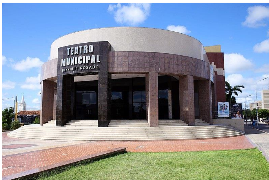
Imagem 03: Fotografia externa / Teatro Municipal Dix-Huit Rosado