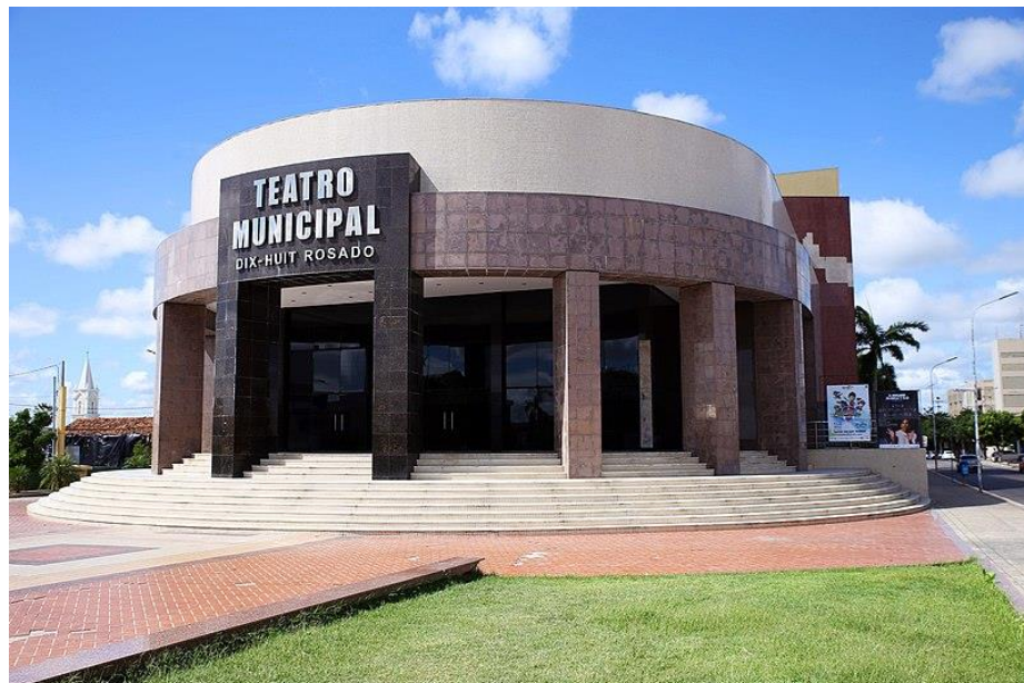
Imagem 03: Fotografia externa / Teatro Municipal Dix-Huit Rosado