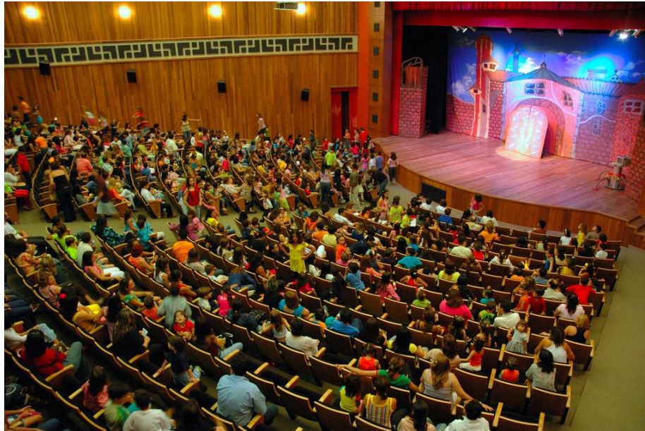
Imagem 02: Fotografia interna / Teatro Municipal Dix-Huit Rosado Fonte: http://www.teatrodixhuitrosado.com.br/ Acessado em 15/08/2019