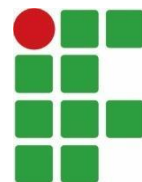
TABELA OFICIAL POR MODALIDADE - QUEIMADA